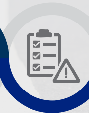
EVALUACIÓN DE RIESGOS