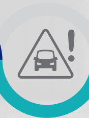
COMITÉ DE SEGURIDAD VIAL